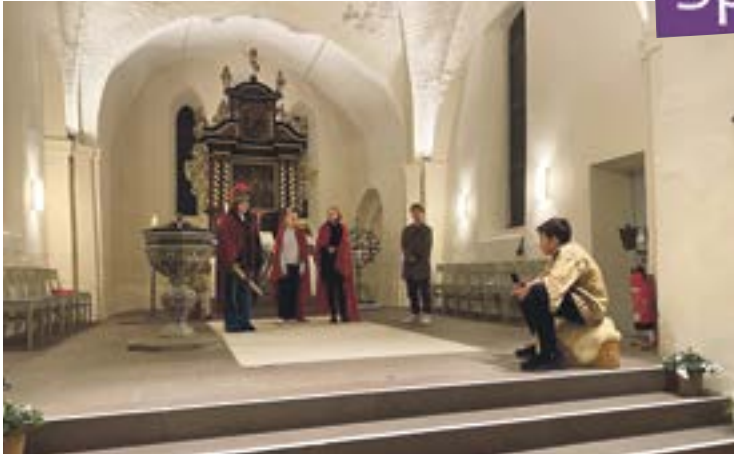
Die Konfirmandinnen und Konfirmanden führten das Martinsstück auf.