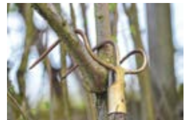
Ein letztes Aufräumen vor der Winterpause.

Das nächste Treffen von „ Hacken und Schnacken “ ist am Dienstag, 5. Dezember um 13.30 Uhr am Gemeindehaus, bevor es in die Winterpause geht. Wer mitanpacken will, ist