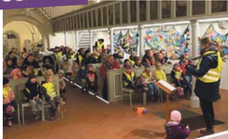
Kita- und Krippenfamilien verfolgten gespannt das Martinsstück in der Kirche.

„Sankt Martin, Sankt Martin, Sankt Martin ritt durch Schnee und Wind...“ – wer in diesen Tagen im Lütje Speelhuus durch die Tür trat, wurde so manches Mal mit einem fröhlichen Laternenlied begrüßt. Denn in den letzten Wo-