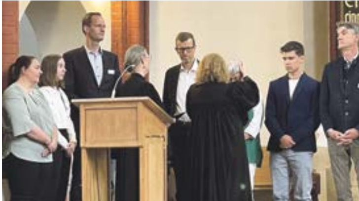
Segen und Neuanfang...