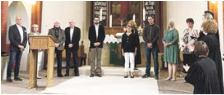
Abschied und Würdigung....