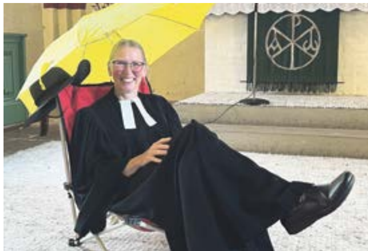
Text und Foto: K. Hermsmeyer

Zum Ende der Sommerferien ließ Pastorin Albertje van der Meer noch einmal Sommer-Sonnen-Urlaubsstimmung aufkommen und verteilte nach einem Gottesdienst voller Musik und kurzen Impulstexten einen Segen mit einem Hauch Sommer.