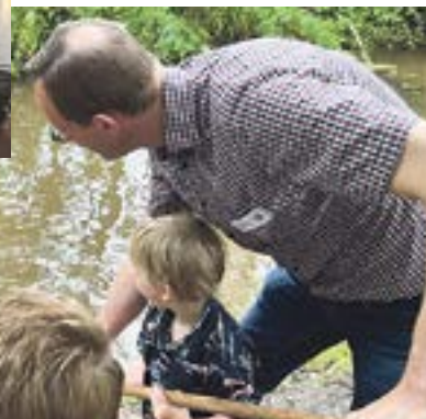
... doch das Taufwasser kam aus der Hache.