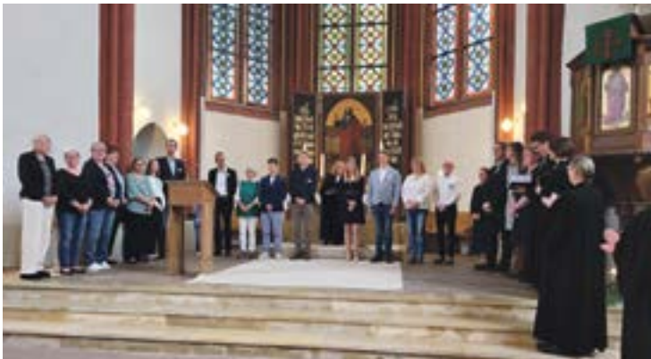
...und Dank für die Übernahme von diesem verantwortungsvollen Amt!