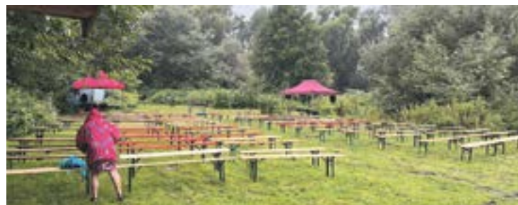
Alles war im Garten des Hachehuus vorbereitet, aber das Wetter...

Text: Katja Hermsmeyer