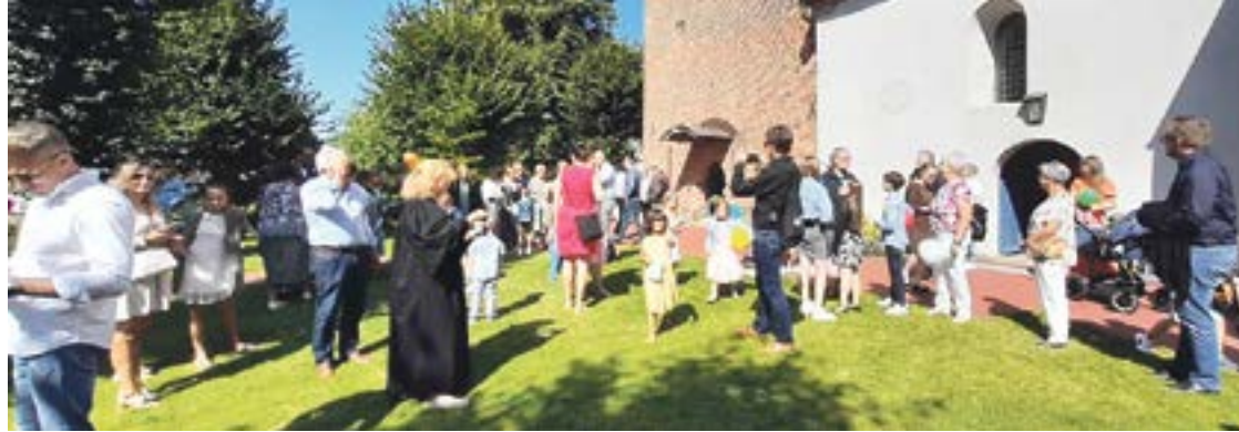
Nach dem Gottesdienst wurden bei herrlichem Sonnenschein auf dem Kirchhof Seifenblasen in den Himmel geschickt.

Am 10. August startet für die Erstklässler die Schule. Viele Kinder und Familien haben sich einladen und erlebten einen lebendigen Gottesdienst mit Bewegungsliedern und einer Mitmach-Aktion.