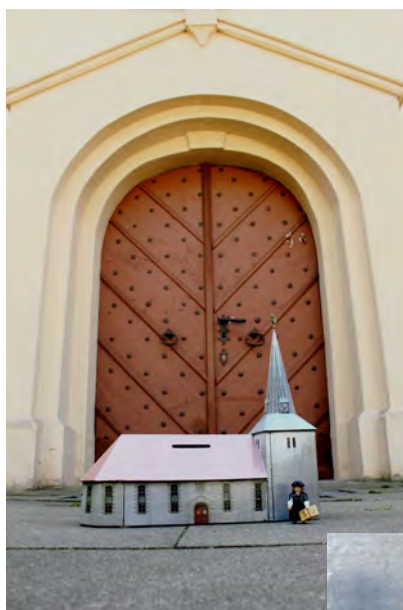
"Martin Luther besucht die Martin-Luther-Kirche"

durch Friedrich Ulrich von Braunschweig 1633 endete jedoch die Rekatholisierung der Stadt und St. Jakobi und die übrigen Peiner Ortschaften erhielten ihre evangelischen Pastoren zurück.