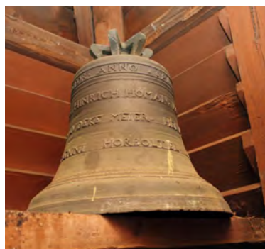
Hat nun Gesellschaft bekommen: Die alte Wehnsener Glocke von 1695