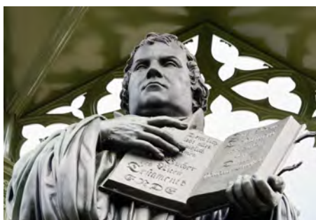
Das Original: Lutherdenkmal auf dem Marktplatz in Wittenberg

Die Spielfigur "Martin Luther" der Firma Playmobil ist ab sofort im Pfarrbüro für 3,- Euro erhältlich.