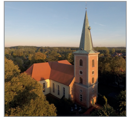
Harpstedt, im Herbst 2023

Heute wenden wir uns an Sie mit unserem Ortskirchengeldbrief 2023. Zunächst danken wir für die Spenden von 2022 in Höhe von insgesamt 12.394,- €!