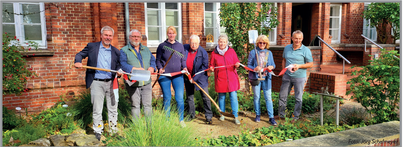
Der Kirchenvorstand bereitet sich symbolisch auf Baubeginn und ersten Spatenstich vor

Der Kirchenvorstand hat beschlossen, das Ortskirchgeld 2023 erneut dem Projekt „Sanierung des Ersten Pfarrhauses“ zuzuführen.