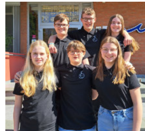
Wir bekommen unseren Segen und dürfen dann mitarbeiten!

Am Konvent finde ich gut, dass es immer einen spannenden Austausch zwischen den Gemeinden gibt und man erfährt, was dort gerade so los ist. Dabei lernt man viel Neues kennen und kann so auch vielleicht einige Ideen mit in seine Gemeinde nehmen. Zudem ist es eine gute Möglichkeit die anderen Jugendlichen, mit denen man vielleicht den Juleica-Kurs gemacht hat, wieder zu sehen und gemeinsam Spaß zu haben.