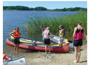
Kanus in Schweden