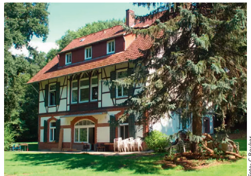
Fenster auf! Türen auf!

Unser Haus liegt in Bad Münde (zwischen Deister und Süntel). Zusammen kochen, essen, den Wald und die Umgebung erkunden, schwimmen im nahegelegenen Freibad und paddeln für die "Großen" auf der Weser. Infos und Anmeldung: Diakonin A. Spremberg Tel. (0 51 37) 87 57 82 oder a.spremberg@alt-garbsen.de