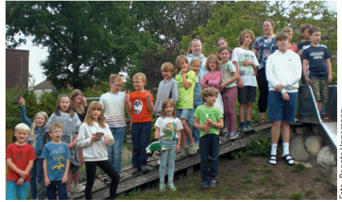
Gruppenbild der letzten Kinder-Bibel-Nacht

Die vergangene Kinder-Bibel-Nacht war von reichlich Turbulenzen in der Vorberei-