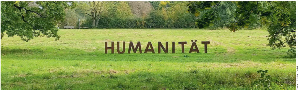
Aufnahme aus dem Hinüberschen Garten