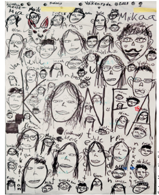
Plakat: Konfijahrgang 2023/24