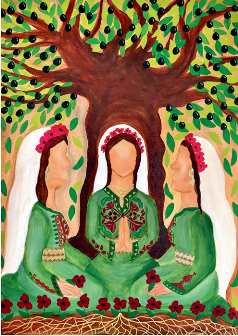
Halima Aziz

am 1. März 2024 um 18:00 Uhr ...durch das Band des Friedens