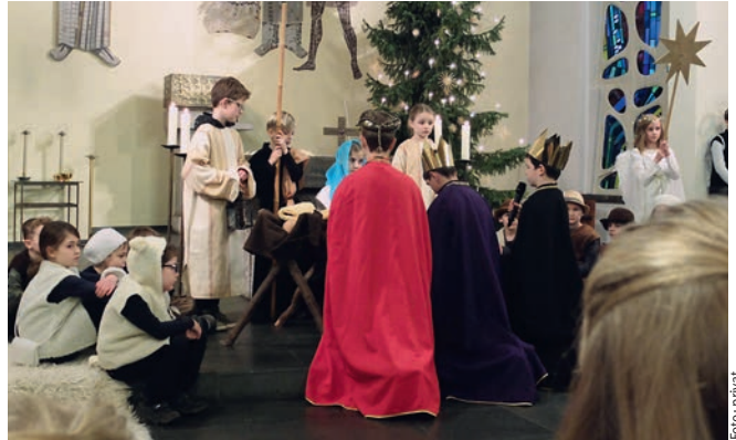
Szene aus dem Krippenspiel in Corpus Christi