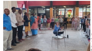
Besuch der Grundschule