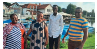
Ausflug nach Steinhude