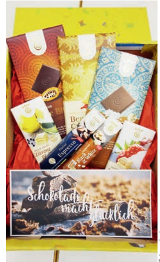
Schokolade nur für Tage, die mit Genden

P.S.: In Ihrem Discounter gibt es viele tolle Fair-Trade Produkte. Unterstützen Sie in diesem Jahr den Fairen Handel mit Ihrem Einkauf. Für mehr Frieden , für mehr Gerechtigkeit , für ein gutes Klima . Denn wenn viele kleine Leute nicht müde werden, dem Wunder leise wie einem Vogel die Hand hinzuhalten, dann zieht Wärme in unsere Stuben ein.