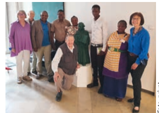
Besuch der Grundschule