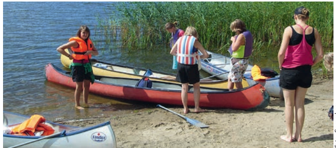
Mit vielen in einem Boot