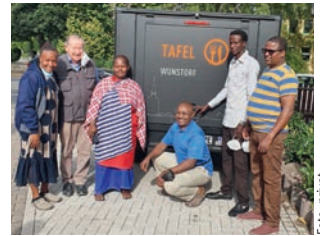
Bei der Tafel in Wunstorf