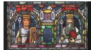
Ausschnitte Buntglasfenster in der Klosterkirche