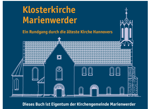
Titelbild vom Buch Kirchenrundgang