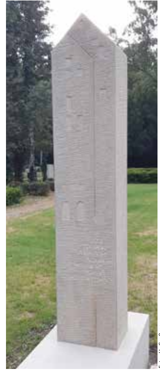
Stele auf dem Friedhof aufgestellt.