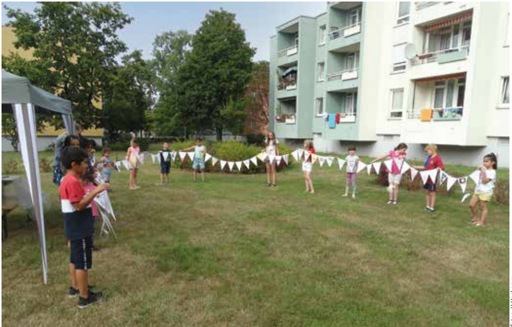
In den Höfen