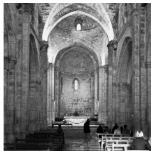
St. Anna-Kirche, Altstadt Jerusalem