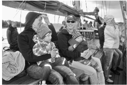
Segeltour auf der Ostsee mit der ganzen Familie

„Ferien sind, wenn Papa und Mama den ganzen Tag Zeit für uns haben.“ „Ferien sind, wenn ich nicht kochen und nicht putzen muss.“ „Ferien sind, wenn ich Zeit mit meiner Familie verbringen kann und ich nicht ständig für meinen Beruf unterwegs sein muss.“ „Ferien sind, wenn ich abends noch ein Buch im Bett lesen kann.“ „Ferien mit anderen Familien gemeinsam zu verbringen entspannt, weil die Kinder miteinander spielen können und auch wir Erwachsene unverplante Zeit haben. Ich habe hier neue Freundschaften geschlossen.“