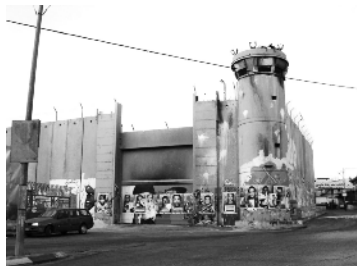
„Papsttor“ in Bethlehem

Kommt und seht – diese Einladung ergeht aus Israel und Palästina. Wer fährt und sieht, begegnet Menschen, die sich wahrgenommen und respektiert fühlen. Wenn Sie unsicher sind, ob Sie in der derzeitigen Situation eine solche Reise unternehmen sollten: fragen Sie nach! Gerd Brockhaus