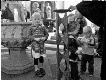
Kleine Leute in der Kirche unterwegs