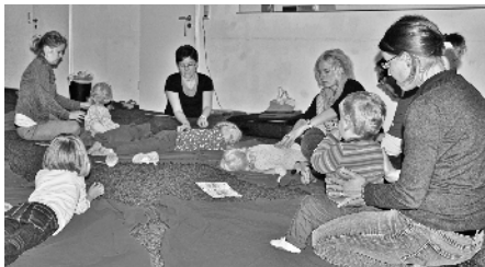
gemeinsam Gute-Nacht-Geschichten hören

7 Tage Familienfreizeit an der Ostsee in den Sommerferien mit insgesamt 46 Personen – das war eine gute Zeit. Familien aus Marienwerder, Havelse, Alt-Garbsen und Garbsen waren hier zusammen. Unser Bildungsthema war: „Vereinbarkeit von Familie und Beruf“ – alle mitreisenden Elternteile sind berufstätig. Der Familiengottesdienst am Sonntag mit der Liturgie der Familienkirche aus Marienwerder hat gut getan. Liebe Ostsee, wir kommen wieder!