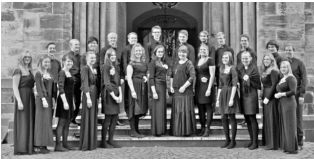
Junger Kammerchor Braunschweig

Die Stiftung wurde im Jahr 2002 gegründet und verfügt aktuell über ein Kapital von ca. 670 Tausend Euro. Von den Zinsertägen wird jeder Cent für Personalkosten der Kirchengemeinde Marienwerder benötigt.