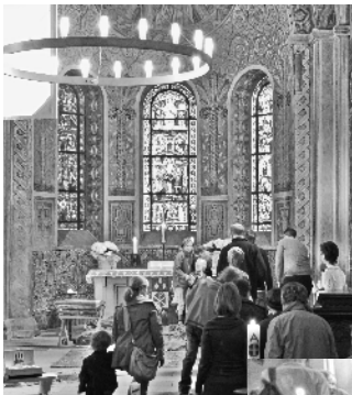
„Steine“ zum Altar bringen