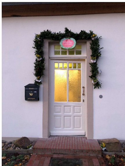
Einzug ins Pfarrhaus