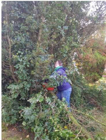
Arbeitseinsatz auf dem Friedhof