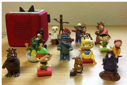
Tonies in der Bücherei