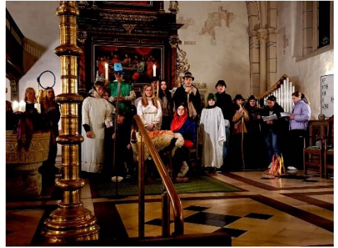
Krippenspiele der Konfis und der Kinderkirche 2023

Beispiele von schon zugeschütteten Löchern – viele Gräber sind aufgrund des Regens eingefallen.